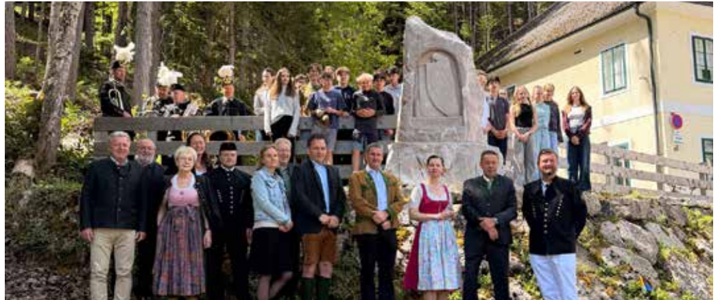
Gemeinsame Einweihung des restaurierten Barbaradenkmals beim Steinberghaus durch Schülerinnen und Schüler, Projektbeteiligte und Vertreter der Region.

Im Anschluss wurde im Steinberghaus die Vernissage eröffnet. Schülerinnen und Schüler der 4. Klasse des BG/BRG Bad Ischl setzten sich im Rahmen eines fächerübergreifenden Projekts in Kunst und Geschichte mit der Kunstgutbergung im Salzkammergut auseinander. Eine Sonderführung durch die Salzwelten Altaussee bildete die inhaltliche Grundlage. Begleitet wurde das Pro-