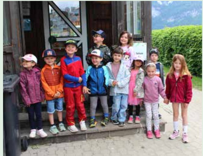
Unser Sommerkindergarten läuft heuer in der Zeit von 13.7. – 7.8.2026 und wird bereits eifrig geplant.

Wir wünschen unseren Großen einen tollen Sommer und einen guten Start in der Schule im Herbst! Wir werden euch vermissen und freuen uns immer über euren Besuch!