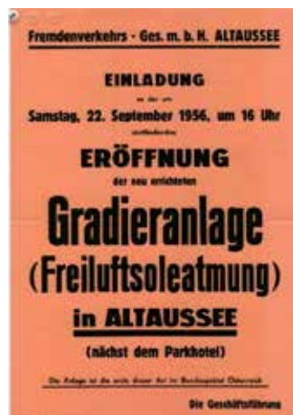
Zum Abschluss ein Blick zurück: Zwei historische Bilder erinnern an die Eröffnung am 22. September 1956 – damals noch ohne den heute bekannten runden Pavillon, der erst später errichtet wurde.