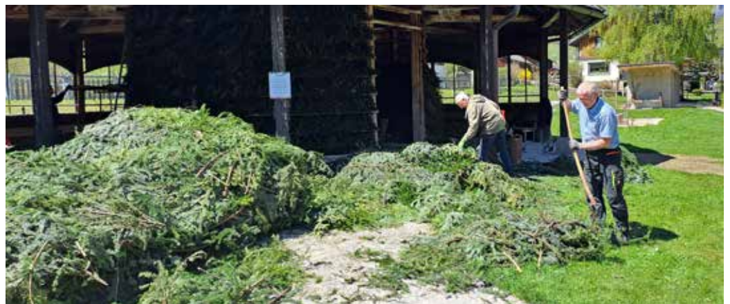
Das Tannenreisig wurde, wie jedes Jahr, von den Österr. Bundesforsten zur Verfügung gestellt und vom Gemeindebauhof aus dem Wald geholt.