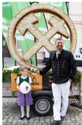
Die Werbefigur „Schlägel und Eisen“ von der Mini Salzburg belegte den zweiten Platz bei den Junioren.