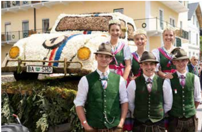
Für „Herbie“ vom Team SHD (See hoch Drei) gab es bei den neuen Gestellen den ersten Platz. In der Kategorie originellste Idee belegte die Figur ebenfalls Platz Eins, bei der schönsten Ausführung den dritten Platz.

Der Festsonntag ist der Höhepunkt des traditionellen Narzissenfests im Ausseerland Salzkammergut. Einen ganzen Tag lang konnten tausende Besucher die 24 Narzissenfiguren, die liebevoll und mit großem Zeitaufwand gesteckt worden waren, im Stadtzentrum von Bad Aussee bewundern und fotografieren. 3.000 Freiwillige beteiligten sich an den Arbeiten am Fest und sorgten dafür, dass Gäste einen unvergesslichen Tag erlebten.