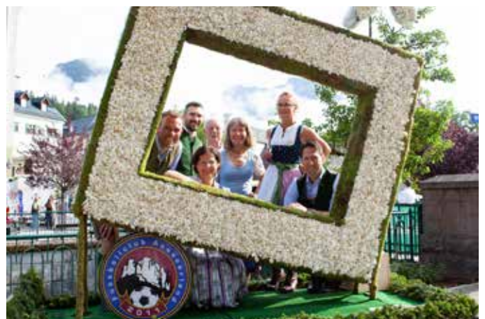
Das Logo Suzuki vom FC Ausseerland holte sich Platz Drei bei den Werbefiguren.