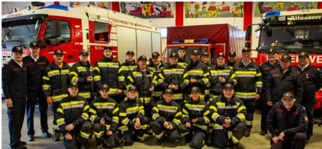
20 Kameradinnen und Kameraden der Freiwilligen Feuerwehr Altaussee absolvierten erfolgreich die Branddienstleistungsprüfung.

Die Branddienstleistungsprüfung ist eine der wichtigsten Prüfungen, zu der Feuerwehren in ihrem eigenen Bereich antreten können, sie umfasst die Einsätze Holzstapelbrand, Flüssigkeitsbrand und Scheunenbrand mit Ausbreitungsgefahr. Diese Problemstellungen sind nach vorgegebenem Schema abzuarbeiten, jeder Einzelne muß seine Aufgaben beherrschen, erschwerend dazu kommt, dass bei der Kategorie Silber, die Positionen der einzelnen Kameradinnen und Kameraden gelöst werden, also ist hier die Vielseitigkeit gefragt. Zusätzlich kommt noch die Gerätekunde dazu, hier ist es notwendig, dass die Probanden bei geschlossenem Feuerwehrfahrzeug die darin gelagerten Geräte wissen und