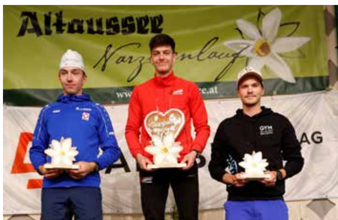
Gewinner Herren 8,1 Kilometer