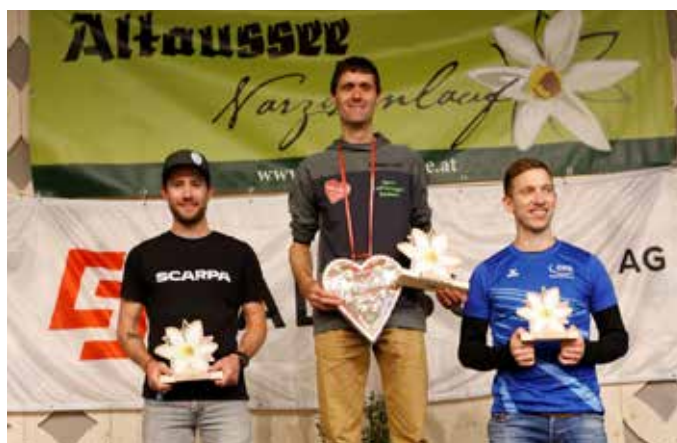
Gewinner Herren 15 Kilometer