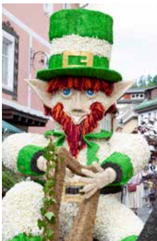
Der dritte Platz bei den Neuen Gestellen ging an die Figur „Lucky Fizz Gerald“ von Familie Schönmaier und Freunde. Für die Figur gab es auch den zweiten Platz für die originellste Idee sowie den ersten Platz für die schönste Ausführung.