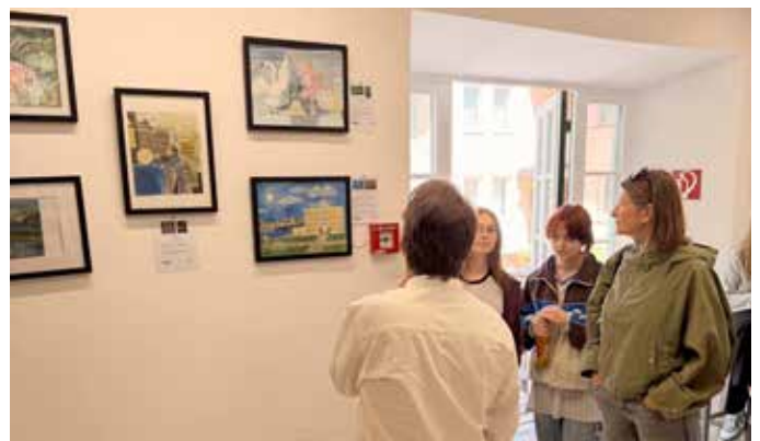
Bei der Vernissage präsentierten Schülerinnen und Schüler ihre Arbeiten zur Kunstgutbergung im Salzkammergut.