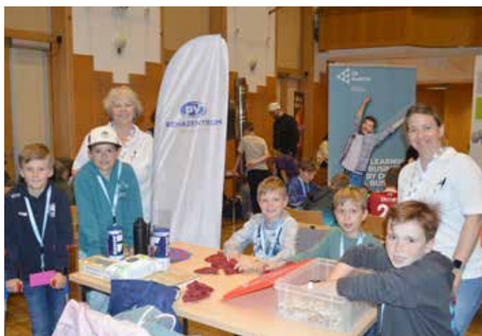
... aus 23 regionalen Unternehmen praktische Aufgaben übernehmen.