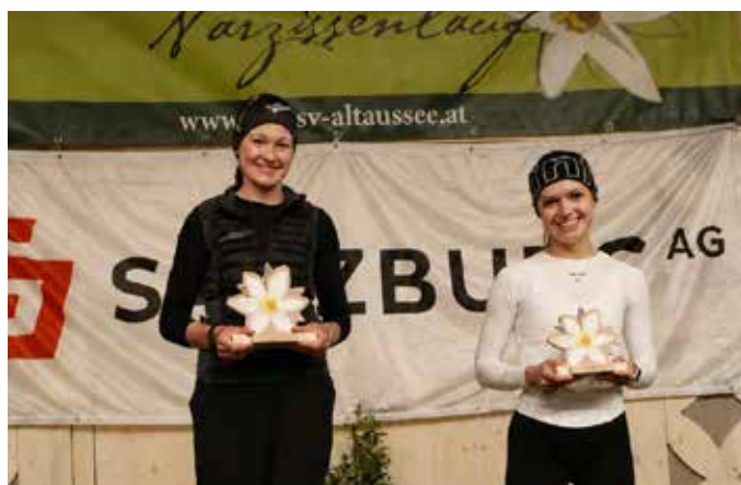
Gewinner Damen 15 Kilometer