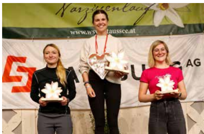
Gewinner Damen 8,1 Kilometer