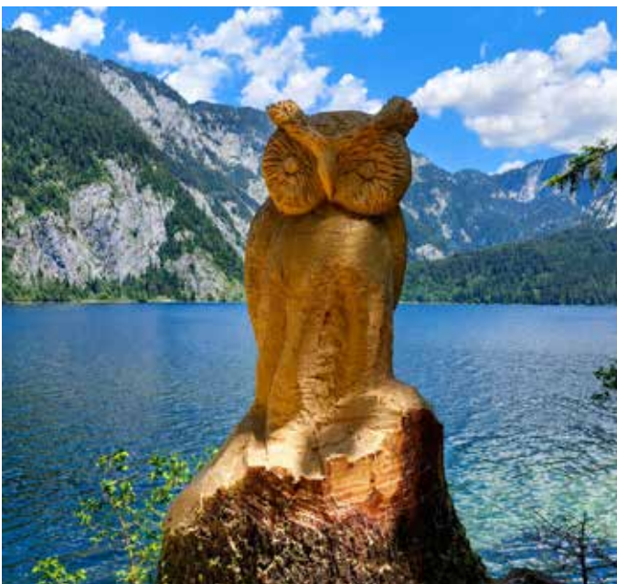
Mit Ruhe alles im Blick - Unsere Wächterin am See

In diesem Zusammenhang wird ausdrücklich darauf hingewiesen, dass das „wilde Deponieren“ von Grün- und Strauchschnitt eine Verwaltungsübertretung darstellt und von der Bezirksverwaltungsbehörde geahndet wird. Leider kein Einzelfall: Siedlungsmüll im Wald entsorgt. Die illegale Ablagerung von Müll wird oftmals als „Kavaliersdelikt“ angesehen. Der Gesetzgeber beurteilt dies jedoch sehr streng. Nach dem Forstgesetz spricht man hierbei von Waldverwüstung. Darun-