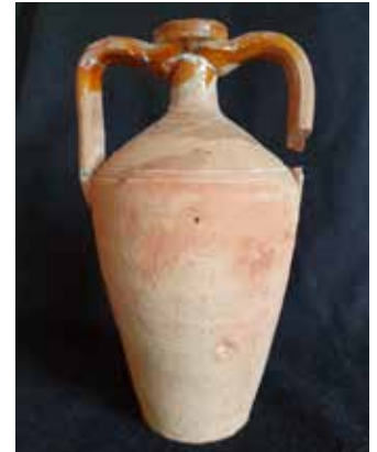
Jahrzehntelang gut behütete Amphore kehrt heim.