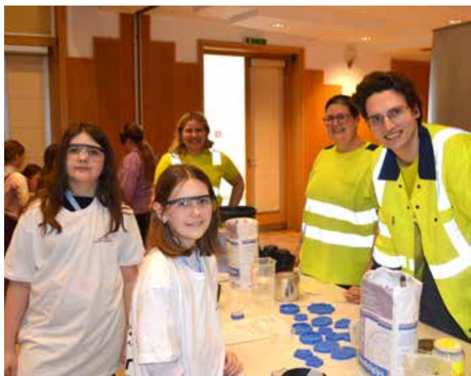
Die Kinder konnten in viele unterschiedliche Berufsbilder eintauchen und unter Anleitung der Fachkräfte ...

Das Projekt wird aus Mitteln des Steiermärkischen Landes- und Regionalentwicklungsgesetzes unterstützt.