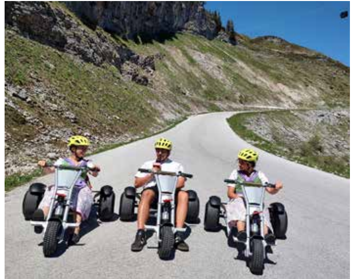
Narzissenhoheiten 2025 genießen die Mountaincart-Abfahrt beim ORF-Dreh.

In der Loseralm findet wieder 14-tägig die „Sommerlaune“ bei feinen Schmanckerln, umrahmt von Melodien der „Ausseer Tanzmusik“, statt. Das nächste Mal schon am 4. Juli, 12–15 Uhr