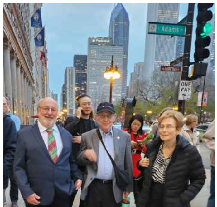
Rachmaninow, Strauss, Wagner - Konzerteinladung der Familie Aronson in Chicago.