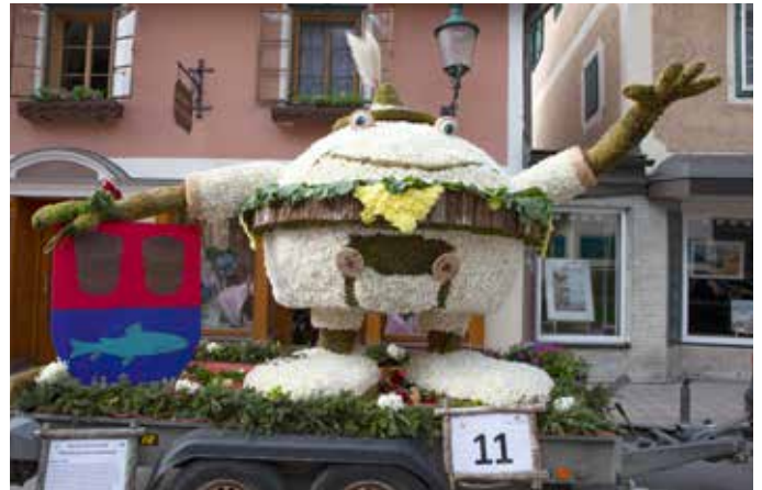
Der „Burger Poid“ vom Kreuz-Gaiswinkel-Musikanten-Stammtisch belegte bei den neuen Gestellen Platz Zwei. Für die originellste Idee gab es den dritten Platz, für die schönste Ausführung Platz Zwei.